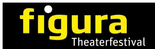
figura Theaterfestival – Baden, Svizzera

In occasione del 15 ° Festival del Teatro di Figura che si terrà nel giugno 2022 a Baden, verrà assegnato un premio incentivo per giovani artisti, di 10.000 franchi svizzeri.